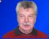
RANDONNÉES Pierre ROBERT